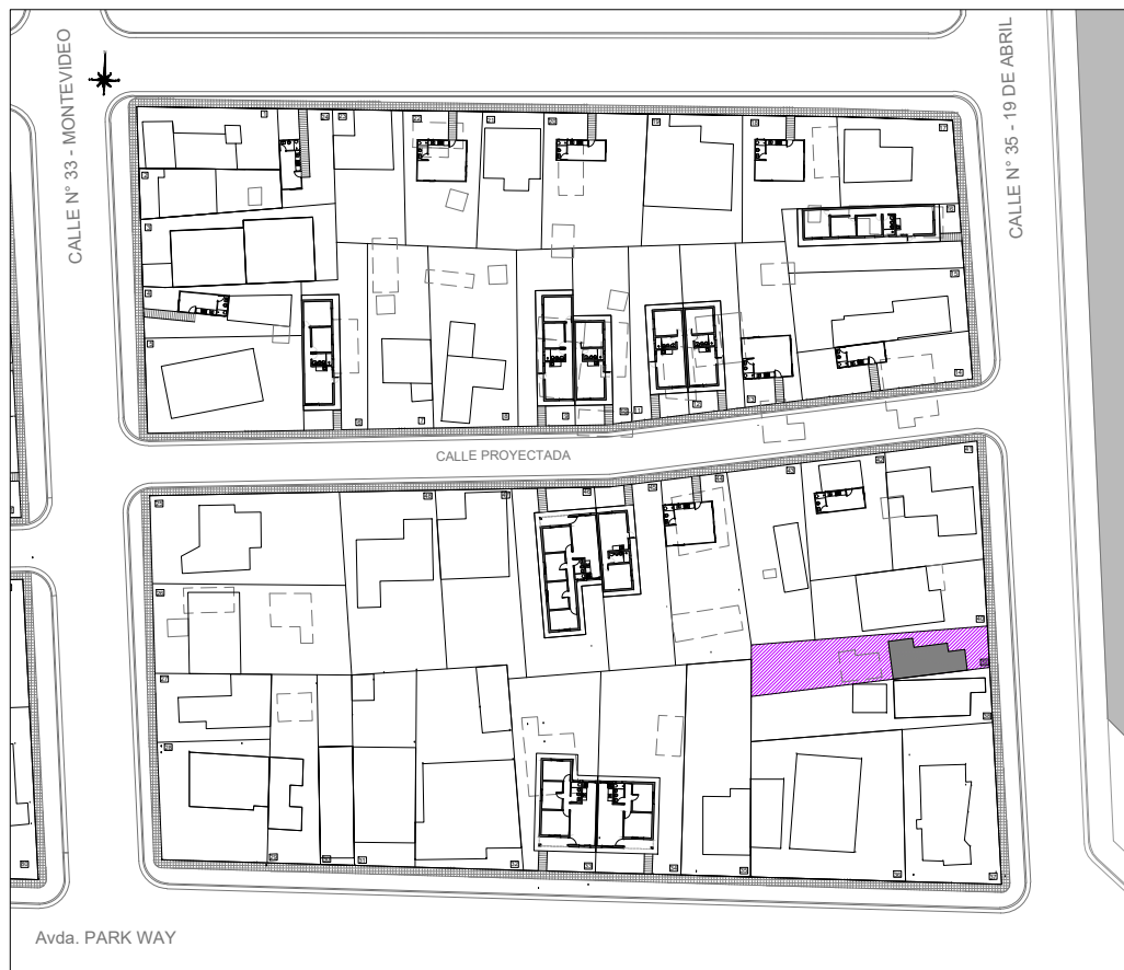
Plano de ubicación esc. 1.1000